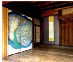
《(コウノイエ)プロジェクト 襖絵「山に抱かれたものたち」 展示風景(熊野市神川町神上集落、2016年)