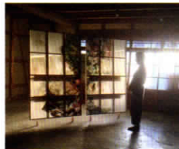
《背面の景色》 岩絵具、水干絵具、麻紙、木製枠 各194.0 x 120.0 cm (2枚組) 2015年